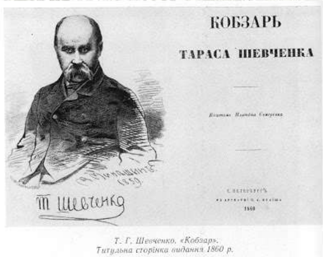
Т. Г. Шевченко. «Кобзарь». Титульна сторінка видання 1860 р.

На наступному фото, оригінал якого, нажаль, не зберігся, Шевченко одягнений в темний костюм. У 1859 році цей знімок послужив зразком для малюнка — портрета, репродукований ксилографією у «Кобзарі» 1860 році, який був виконаний М. Мікешиним.